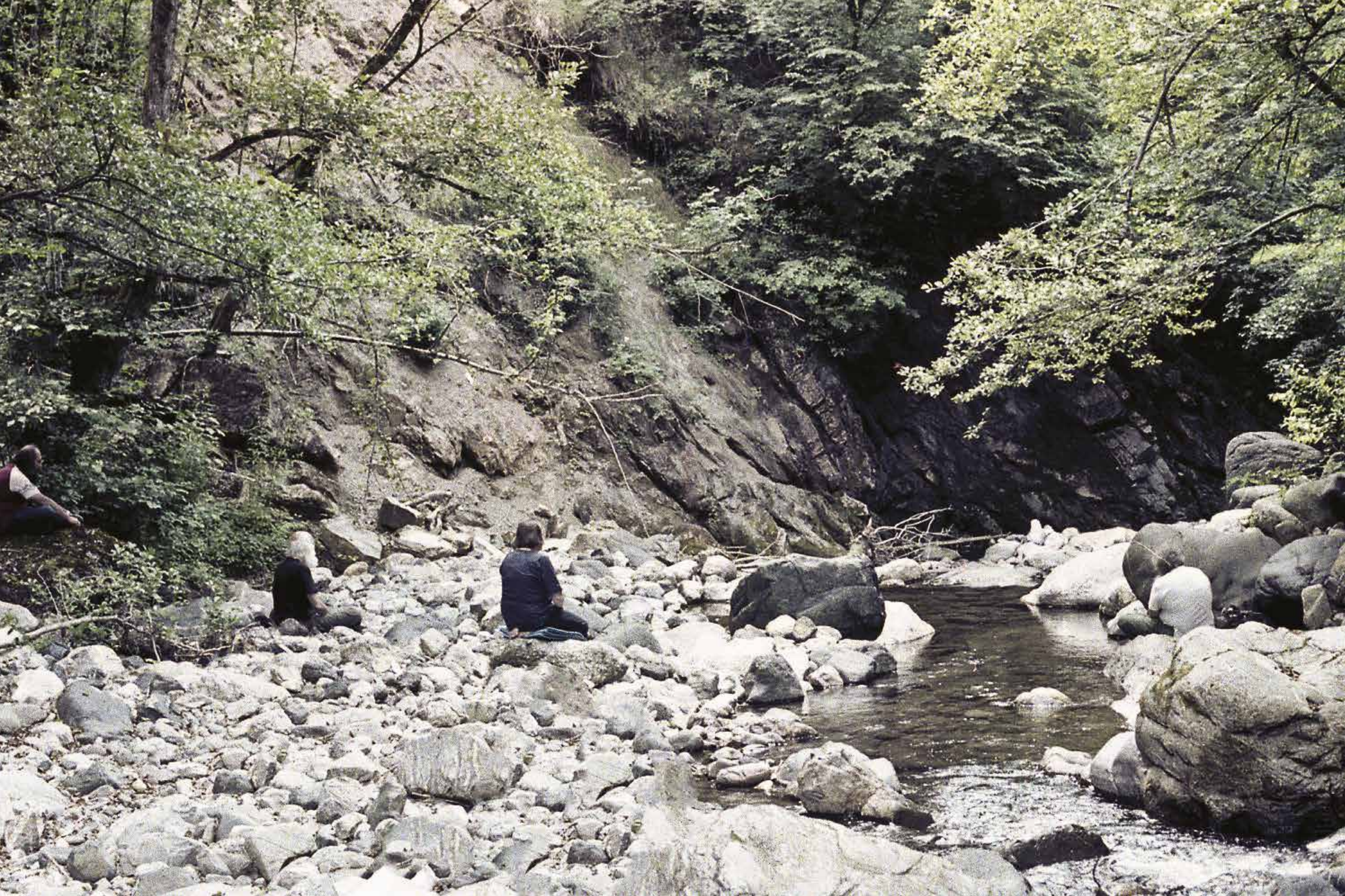
Meditazione al torrente a San Venerio