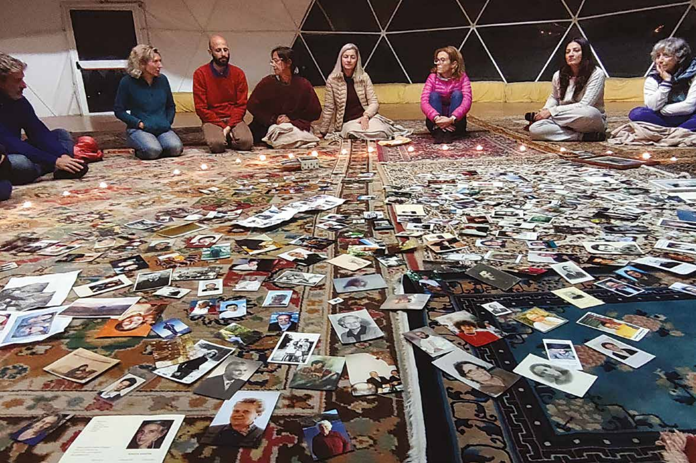
Durante la veglia per i defunti a San Pietro Vara