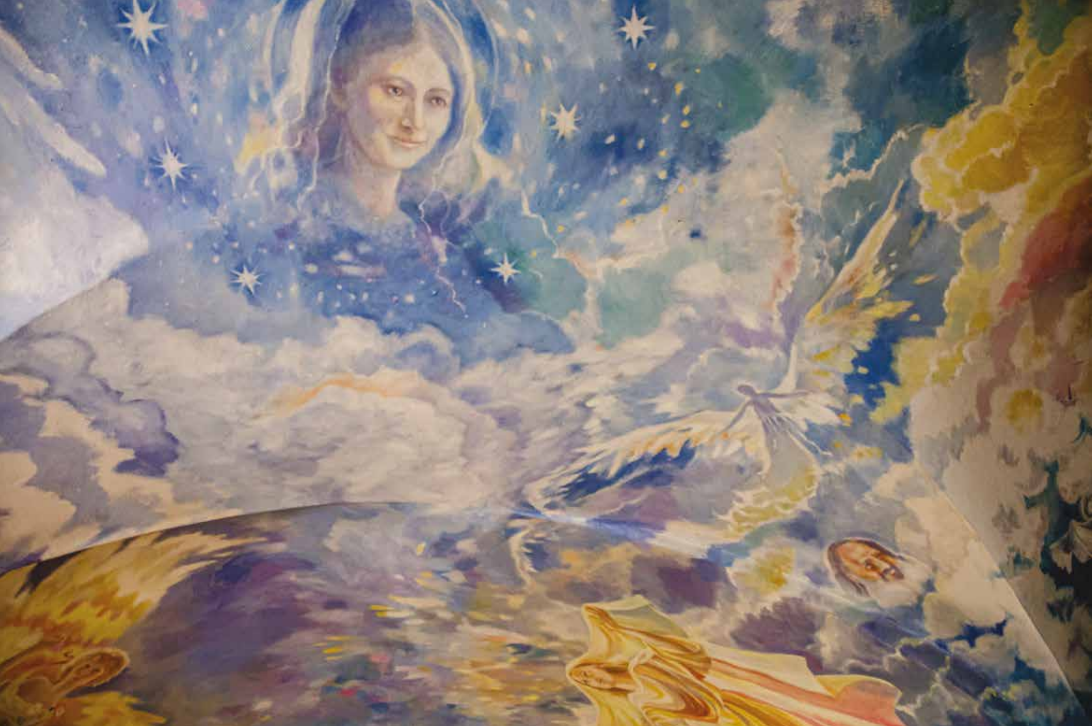
Affresco della volta in sala di meditazione nella sede di S. Pietro Vara dipinta da Adriana Profita