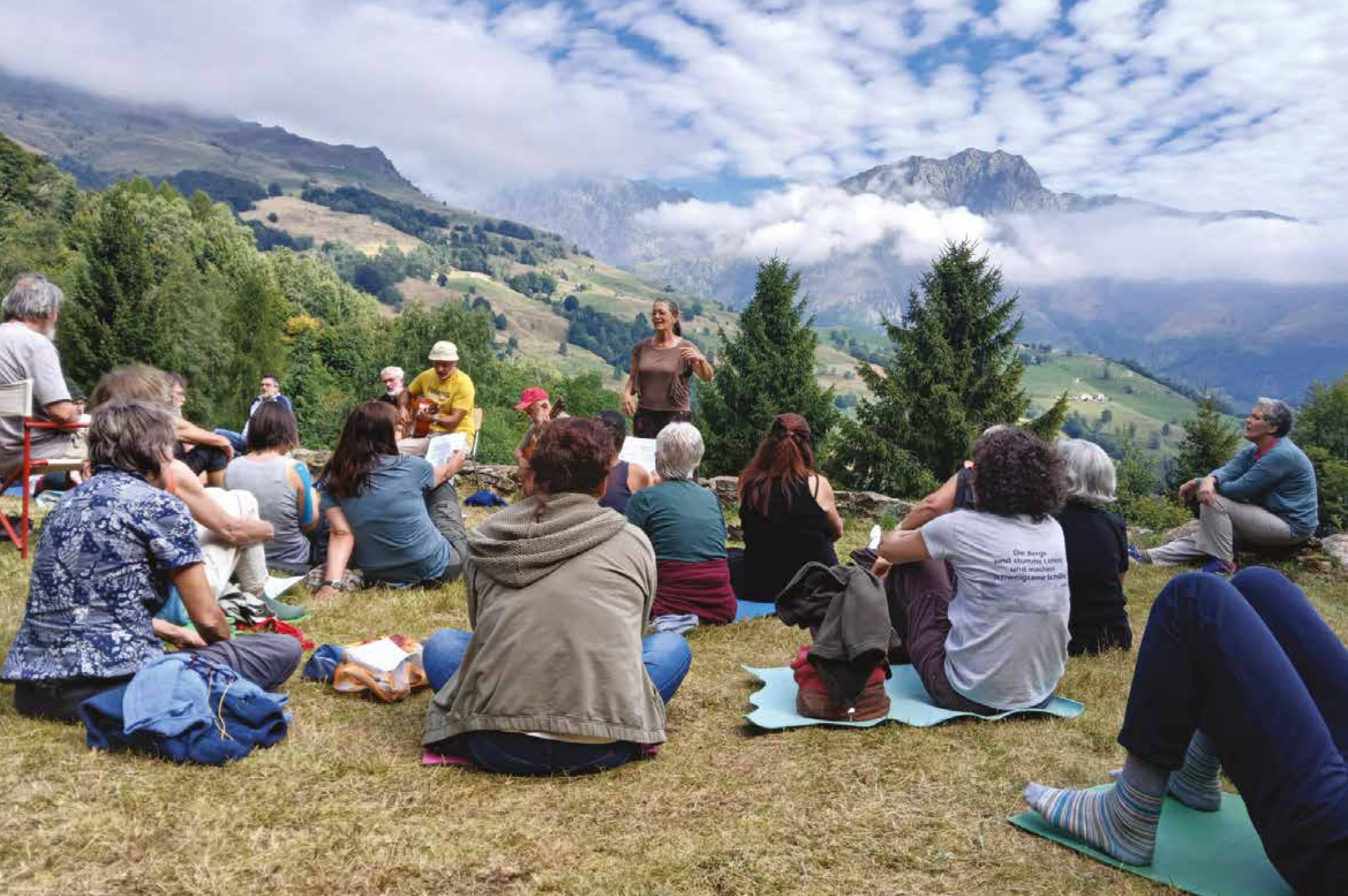
Cascina di S. Esuberanza, sopra Biella, storica sede di training estivi.