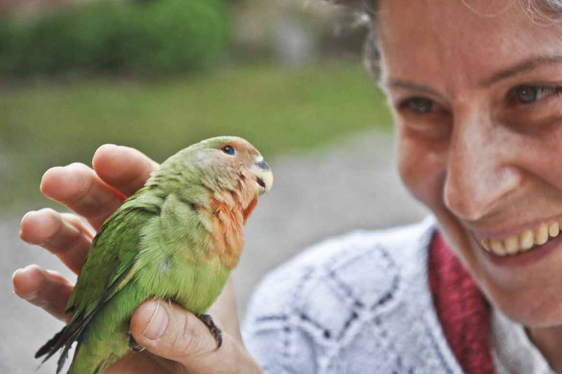
Feeling con Kiki