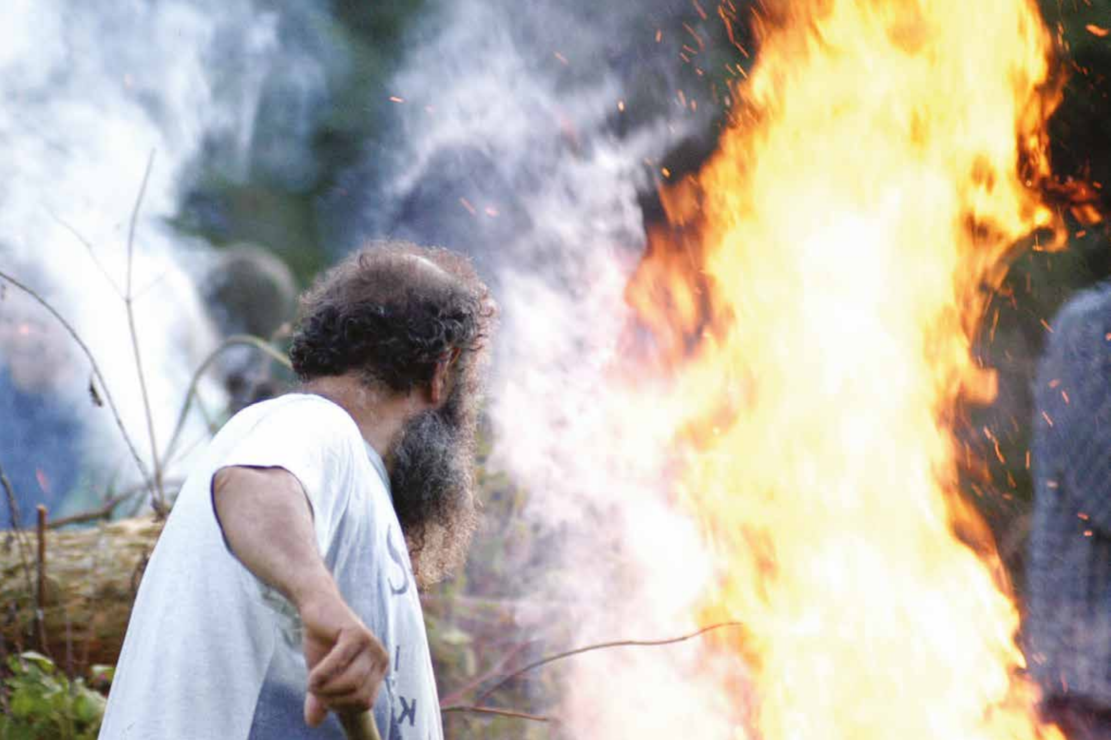
Durante un training del 2007 nella Cascina di San Giuliano a Soriso (No)