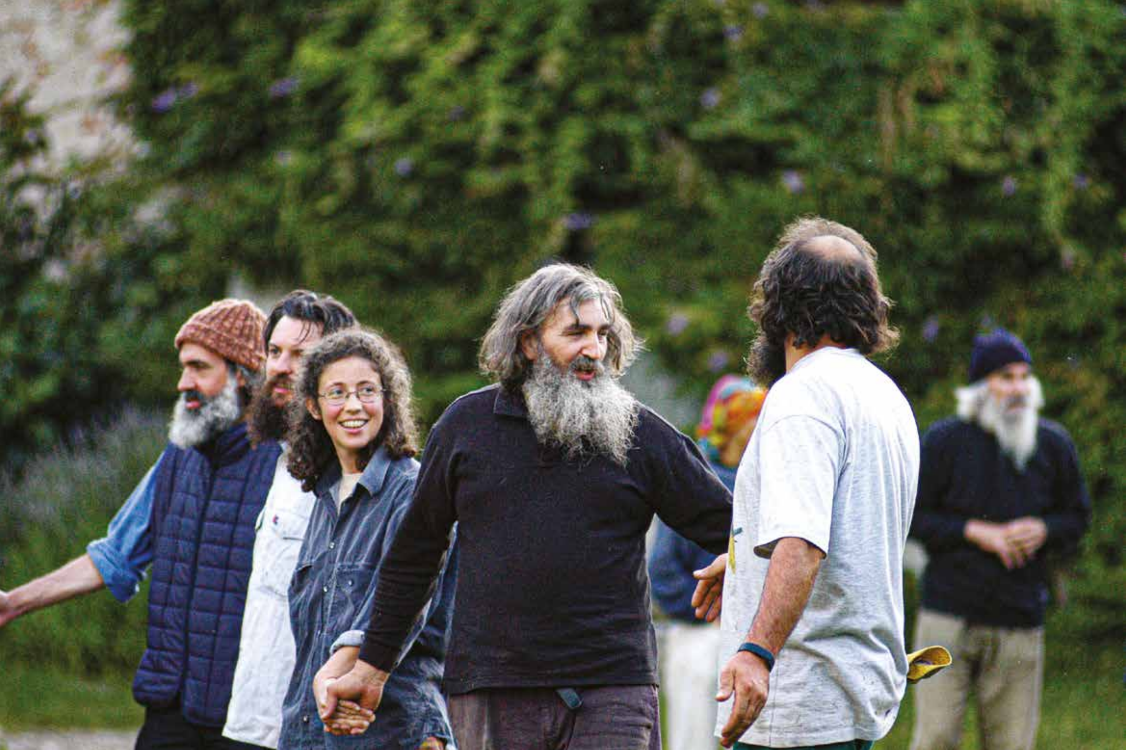
Danze al training