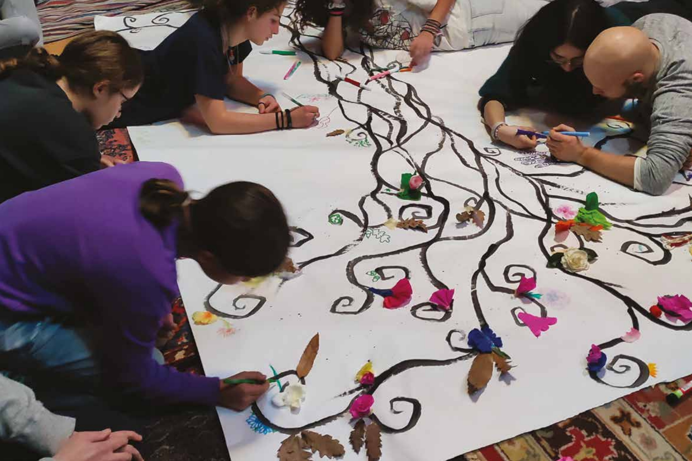
Lavoro di gruppo nella sede di San Pietro Vara